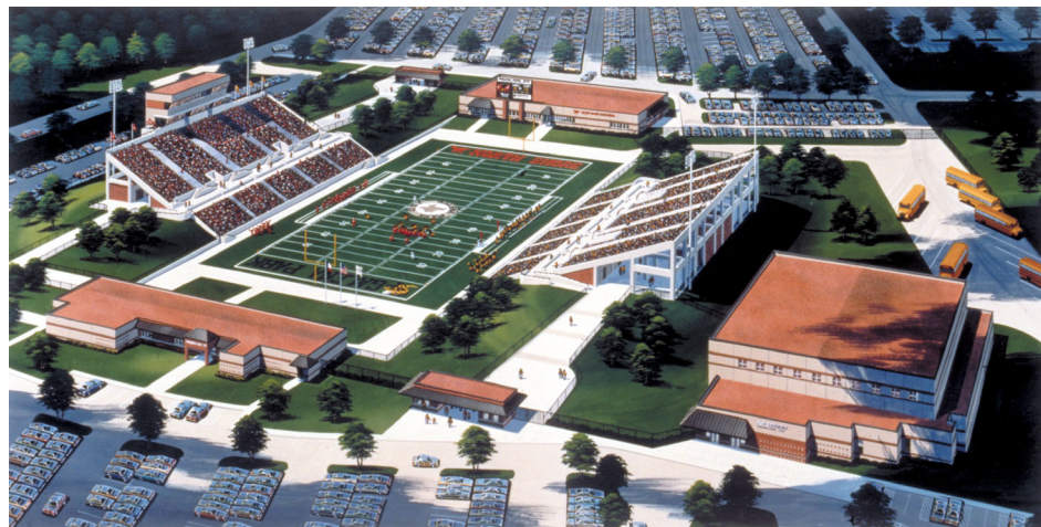
District Athletic Complex