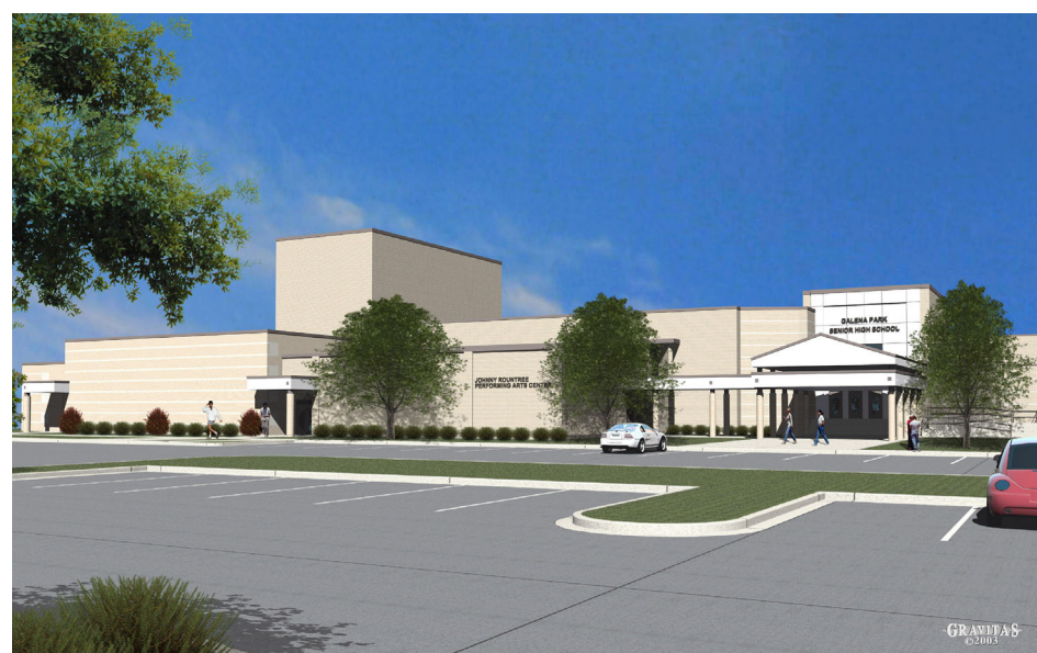
Galena Park High School Performing Arts Center