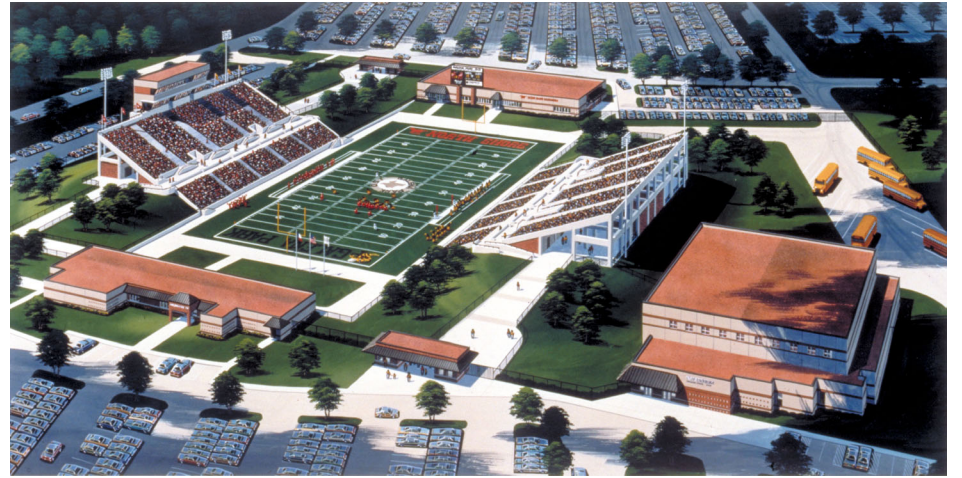
District Athletic Complex