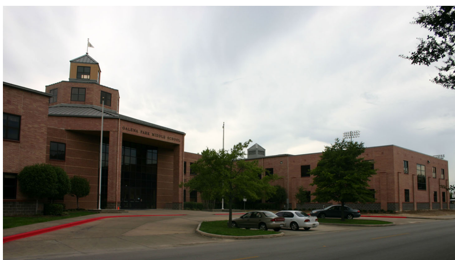
Galena Park Middle School