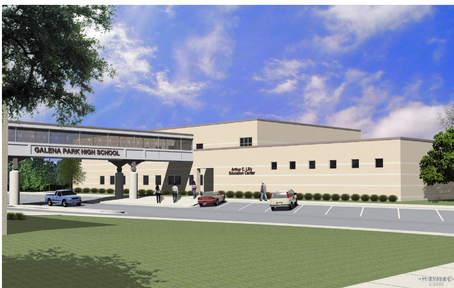
Galena Park High School Education Center