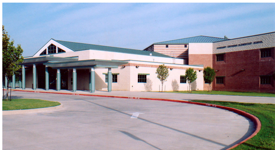
Normandy Crossing Elementary