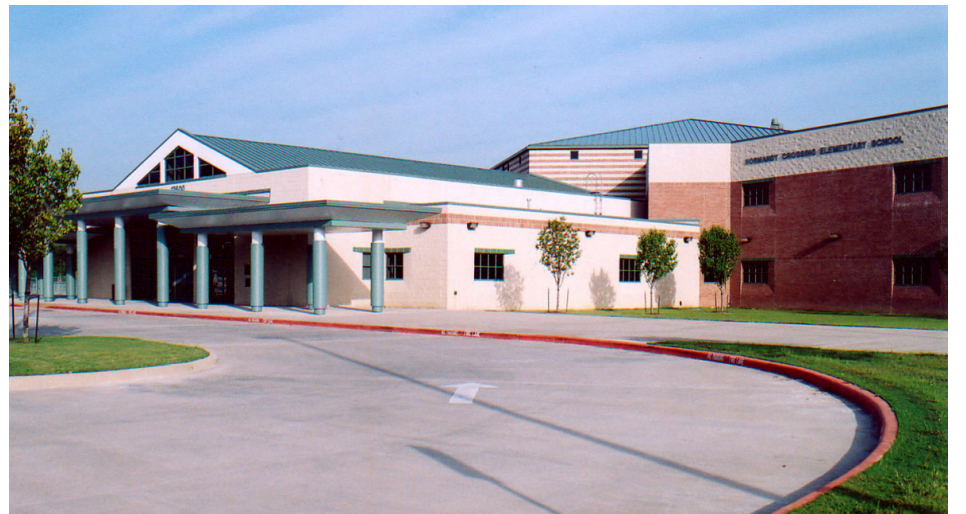
Normandy Crossing Elementary