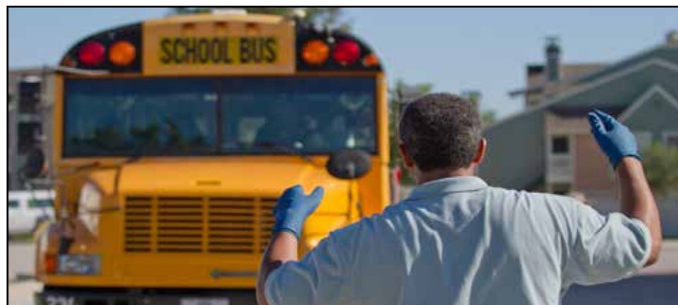
Los choferes de autobuses y personal del Departamento de Transportación forman parte de un "rodeo" de autobuses. La competencia forma parte de los muchos entrenamientos en el que participa el personal cada año.

Durante los últimos 50 años, los autobuses escolares han sido mejorados continuamente teniendo en mente la seguridad y el rendimiento. Siendo que los grandes autobuses escolares tienen una masa mucho más grande que un auto o una camioneta, es menos probable que uno de ellos sea severamente dañado