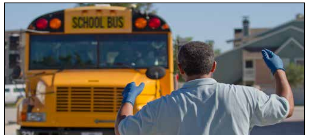
Bus drivers and transportation personnel take part in a bus "rodeo." The competition is one of many trainings the transportation personnel participate in each year.

Over the past 50 years, school buses have been continuously upgraded with safety and performance in mind. Because large school buses have a much greater mass than an