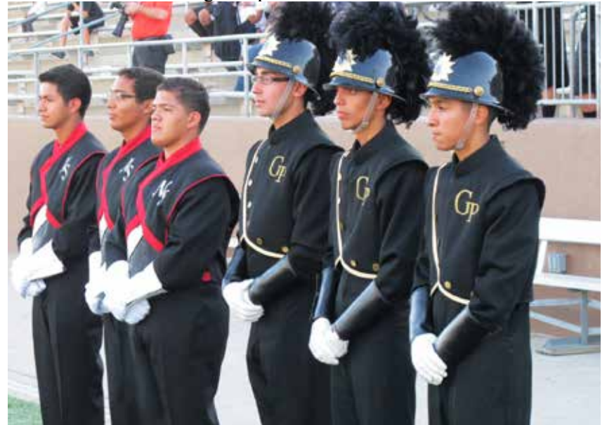
NSHS & GPHS drum majors from the 2011 Marching Band Festival

For more information about the festival, including bands participating and performance times, please visit the Fine Arts link in the "Quick Links" section of www.galenaparkisd.com .