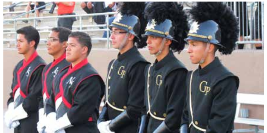
Bastoneros de GPHS & NSSH del Festival de Bandas de Marcha 2011

Para información adicional acerca del festival, incluyendo las bandas que participan y el horario de las presentaciones, por favor visite Fine Arts en la sección de enlace “Quick Links” de la página web del Distrito en www.galenaparkisd.com .