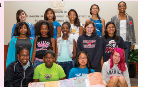
Jovencitas de secundaria asistieron a la primera Academia de Liderazgo para Jovencitas donde exploraron temas tales como valentía y auto imagen positiva. Participaron en numerosas actividades, incluyendo la hechura de una colcha decorada con sus fortalezas personales.

Esta excelente experiencia continuará para construir las destrezas de liderazgo de las adolescentes en nuestra comunidad como un recurso para el futuro. Con las excelentes cualidades de liderazgo de estas esplendorosas jóvenes damitas en la primera Academia de Liderazgo para Jovencitas de GPISD, la comunidad definitivamente verá los beneficios de la inversión en estas estudiantes.