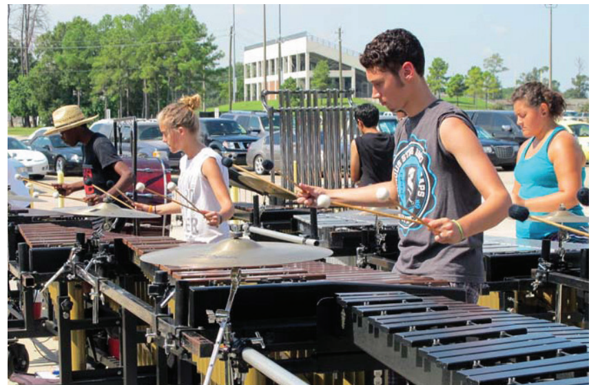
Band students prepare for the upcoming marching season during summer practice.

For more information about the festival, including bands participating and performance times, please visit the Fine Arts link in the "Quick Links" section of www.galenaparkisd.com .