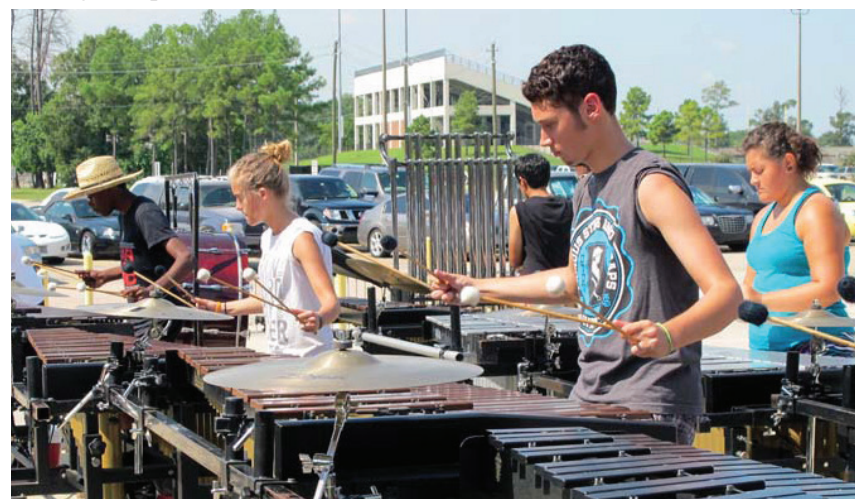
Los estudiantes de banda de marcha practican durante el verano para prepararse para la próxima temporada.

Para información adicional acerca del festival, incluyendo las bandas que participan y el horario de las presentaciones, por favor visite Fine Arts en la sección de enlace “Quick Links” de la página web del Distrito en www.galenaparkisd.com .