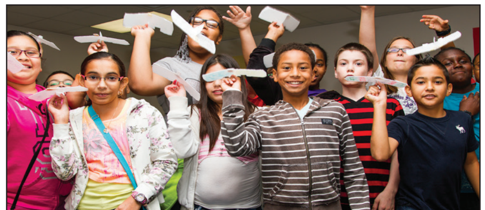
Students learned the principles of aerodynamics, and then applied their knowledge by building kites, rockets, and other objects related to flight.

On July 11, 2013, 275 Galena Park ISD students participated in the fourth year of NASA's Summer of Innovation, a weeklong program aimed at students entering 6th-9th grades to promote STEM (science, technology, engineering and math) skills. As an ongoing White House initiative, the Summer of Innovation is designed as a camp for students to explore, create and experiment. The seven day academy, led by teachers trained in innovative NASA curriculum, was filled with unique and engaging activities based on actual NASA experi-