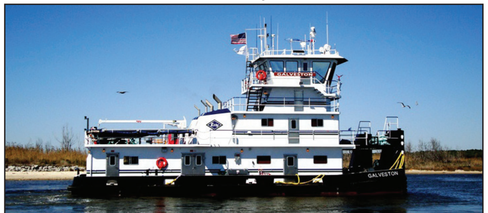
Kirby Inland Marine, Inc. partners with Galena Park ISD to offer students immediate employment opportunities upon completion of the Maritime courses.

nificance to global shipping, this new program has the potential to offer students an excellent entry into lucrative workforce positions. Once employed full-time in the industry, certified graduates of the program earn $130.00 per day. As part of a long-range strategic workforce plan, Kirby Inland Marine, Inc. foresees training GPISD graduates of the Maritime Industry program for future captain positions with the company towing vessel. While working toward receiving their captain's permit, deck hands earn four additional Coast Guard required credentials: tankerman; 3 rd mate; 2 nd mate; and 1 st mate. A captain's salary begins at $500 per day, making advancement for graduates with these specialized credentials quite significant.