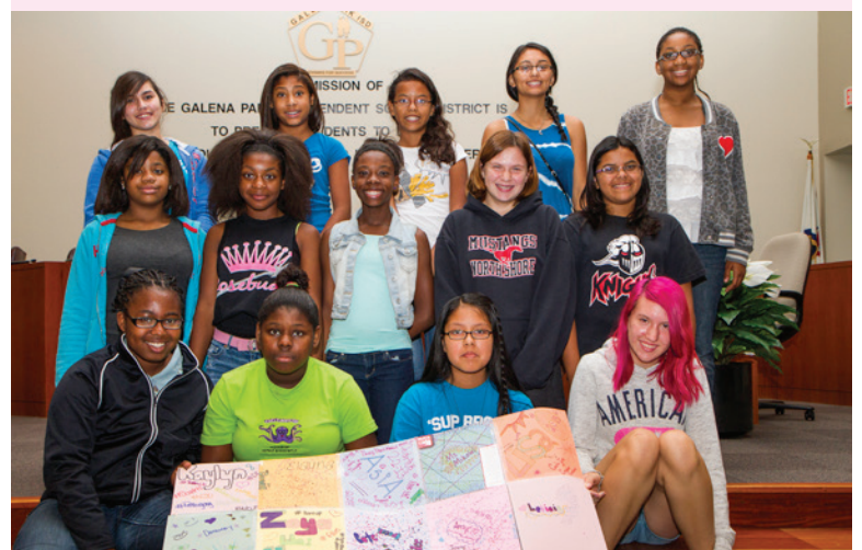
Middle school girls attended the first Leadership Academy where they explored topics such as bravery and positive self-image. They participated in numerous activities, including making a quilt decorated with their personal strengths.

This unique experience will continue to build on the leadership skills of the teenagers in our community as a resource for the future. With the outstanding leadership qualities of these blossoming young ladies in the first GPISD Girls' Leadership Academy, the community will definitely see the benefits of investing in these students.